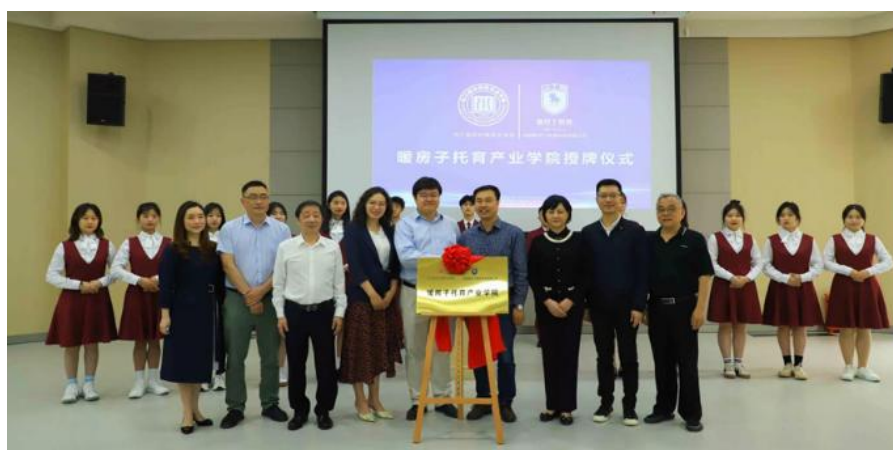
（“暖房子托育产业学院”揭牌仪式）

学校、机构双方共建托育专业实训就业基地，为学生提供实习见习岗位，暖房子作为首批成都市示范性托育机构，目前在成都市区已有八家门店，实训场地充足，在培养托育人才方面可以真正实现育训结合，知行合一；同时毕业后可以优先推荐进入合作企业工作。