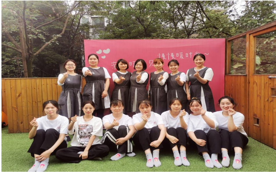
图5 学生到暖房子托育机构专周实训与带班老师的合影