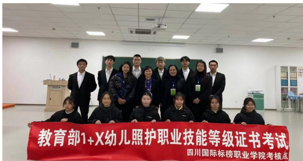
图4 教育部 1+X 幼儿照护证书考试考评员与学生合影

我校作为教育部 1+X 幼儿照护证书考试试点院校，在 2020 年 12 月份组织的首次教育部 1+X 幼儿照护中级证书考试，本专业共 40 名学生参加考试，终有 39 名同学通过考试并拿到证书，通过率 97.5%。